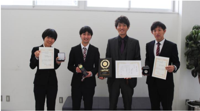
学位記伝達式にて